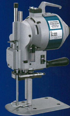
Straight Knife KS-AUV