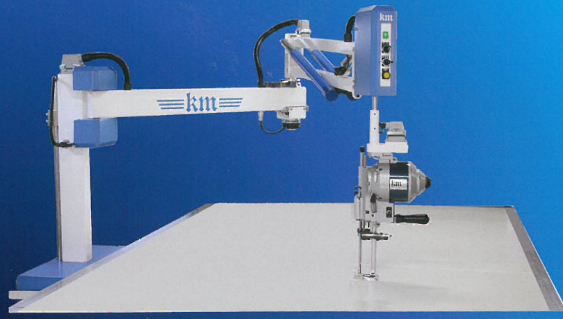
Light Cutter KLC-2000N