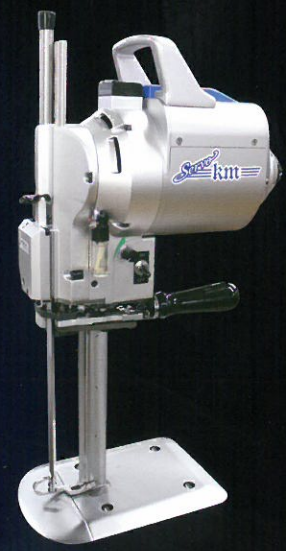
Servo Cutter KM-SV