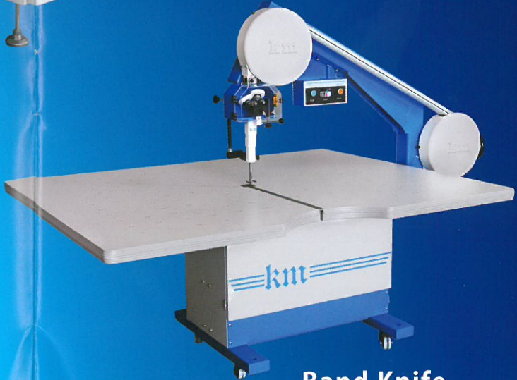
Band Knife KBK-900M