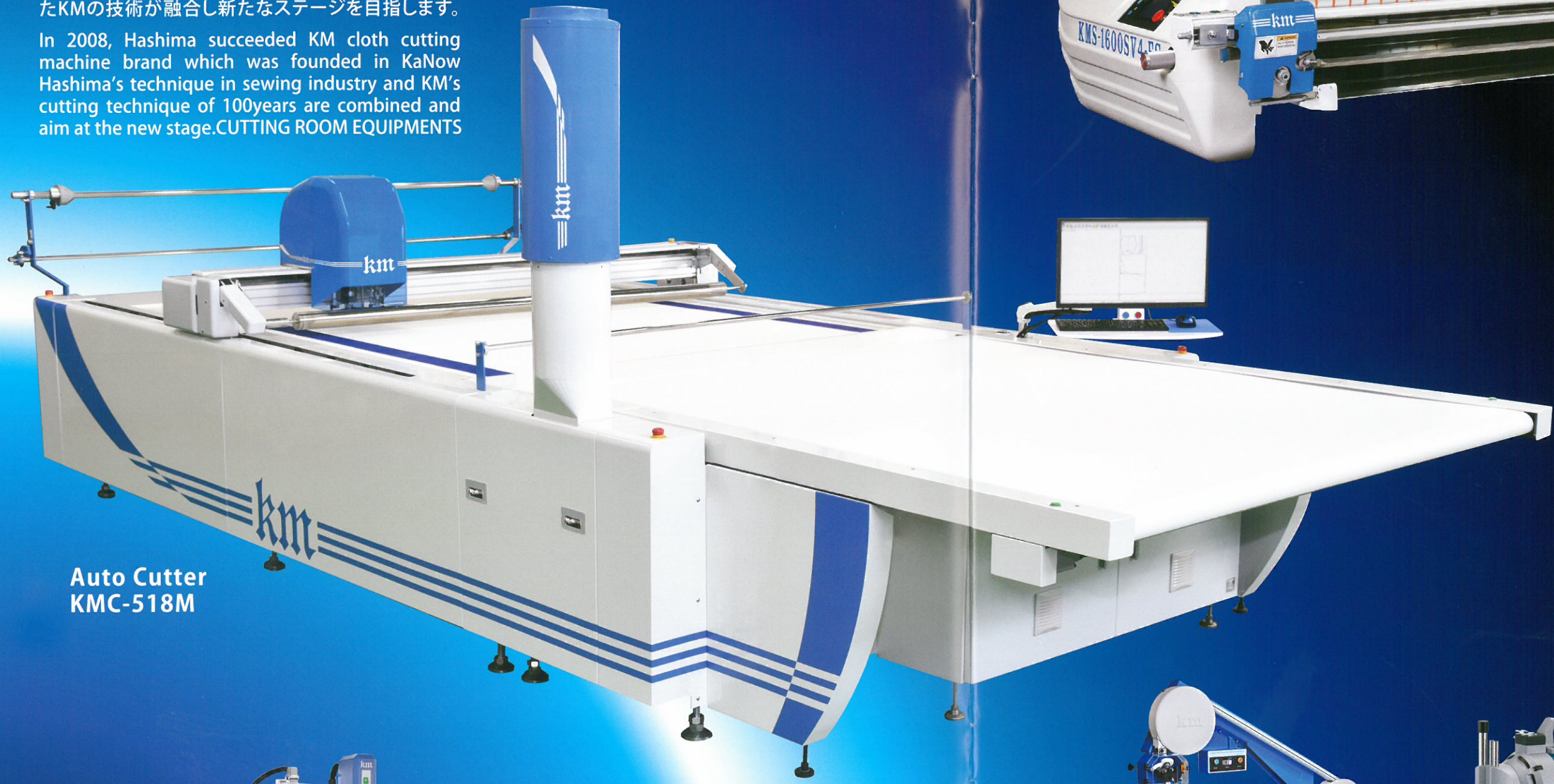
Auto Cutter KMC-518M